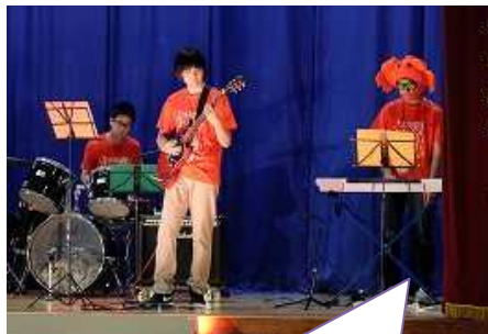
3年生は昨年に引き続きDJ&バンド。アニメソングで会場を沸かせました。

各学級で工夫を凝らしたお楽しみコーナーやステージ発表、全校で取り組んできた合唱や船中 YOSAKOI。テーマに込められた感謝の気持ちを伝えようと全校生徒が力を合わせました。さらに保護者の方には食品バザーの協力をいただきました。地域の方の喜ぶ顔や「良かったよ」という激励の言葉に、生徒達は大きな自信と満足感を得ることができました。「地域に支えられ、愛される船中」を実感する1日になりました。