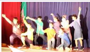
2年生の発表はダンス。協力してリズムに乗った踊りを披露しました。