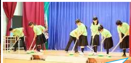
1年生はストンプやカップスなどの新ジャンルに挑戦しました。