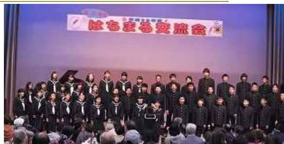
合唱講習会での合わせから1ヶ月。香中・船中それぞれが練習や発表の場を重ね、当日の合同合唱披露となりました。