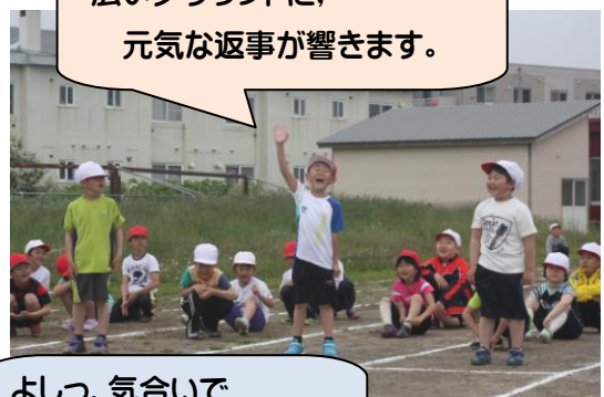
広いグラウンドに、 元気な返事が響きます。