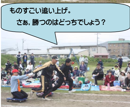
ものすごい追い上げ。 さあ、勝つのはどっちでしょう？