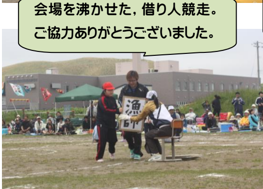
会場を沸かせた、借り人競走。 ご協力ありがとうございました。