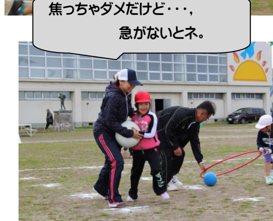
焦っちゃダメだけど・・・、 急がないとネ。