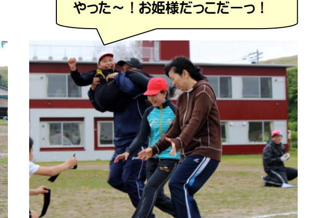
やった～！お姫様だっこだーっ！