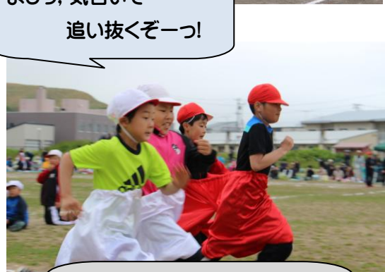
よしっ、気合いで 追い抜くぞーっ！