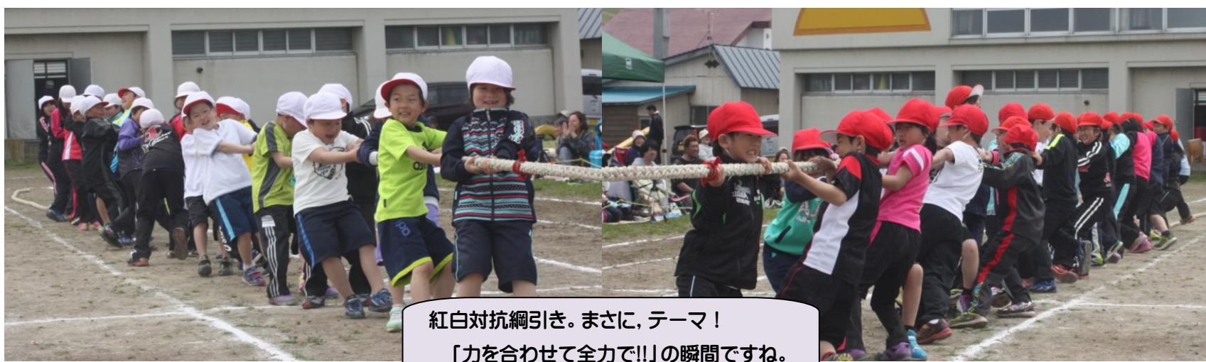
紅白対抗綱引き。まさに、テーマ！ 「力を合わせて全力で!!」の瞬間ですね。