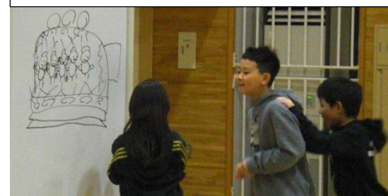
一年生からマントを受け継ぎました