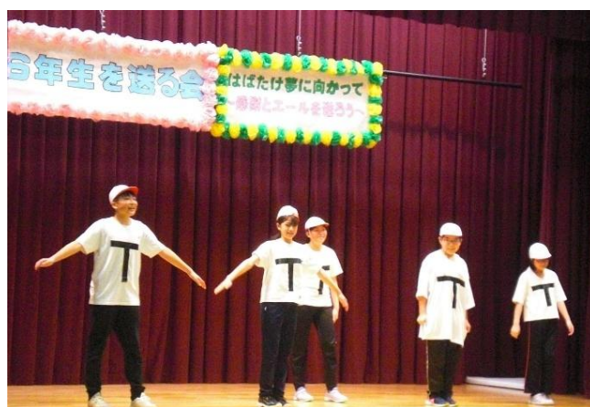
6年生 1年間で成長した姿を寸劇や俳句、ネタなどで紹介しました