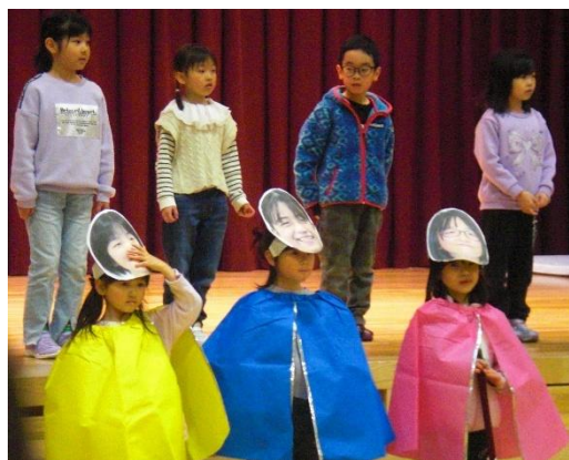
1年生 劇『たすけて6ネンジャー』