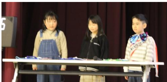
2年生 クイズ『6年間を振り返って』