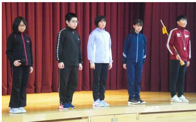
6年生から後輩に向けてのメッセージ