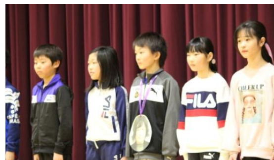
3・4年生 6年生へのメッセージとテレパシーお絵かきリレー