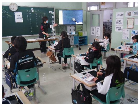
書写での書画カメラ活用(3年生)