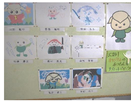
タブレットで制作したオリジナル「あつもん」(4年生)