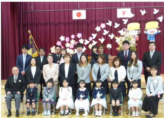
←入学式前に体育館で記念撮影 教室でも記念撮影↓