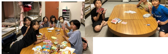
就寝前の自由時間 船小の人と遊びました♪