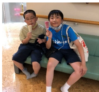
童夢温泉 お風呂上りのアイスは美味しいな