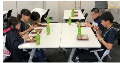
映画を振り返りながらお弁当