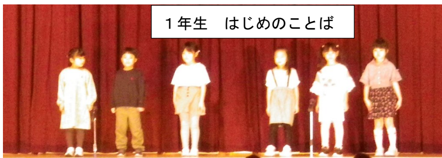
1年生 はじめのことば

今年は、体調不良により十分に練習に参加できなかった児童も多かったのですが、当日は堂々と舞台に立ち、自分の持てる限りの力を発揮していました。保護者の皆様をはじめ、ご来賓や地域の皆様の声援が、子どもたちに自信を与えて下さったおかげと、改めて感謝申し上げます。