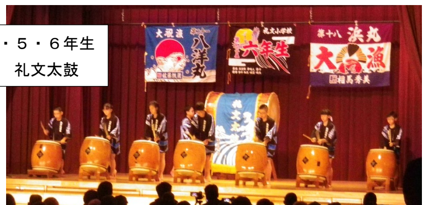
4・5・6年生 礼文太鼓