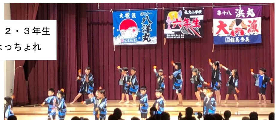
1・2・3年生 よっちょれ