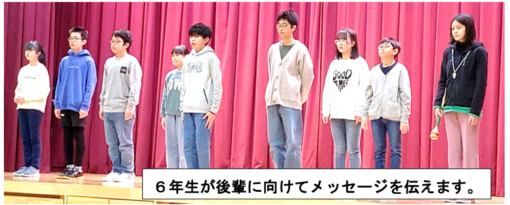
6年生が後輩に向けてメッセージを伝えます。