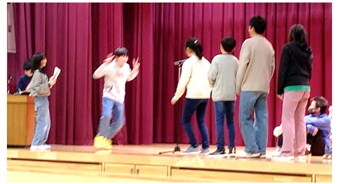
3・4年生 ジェスチャーゲーム