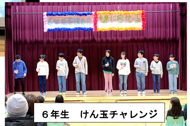
6年生 けん玉チャレンジ