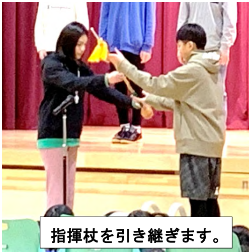
指揮杖を引き継ぎます。