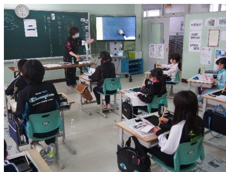
書写での書画カメラ活用(3年生)