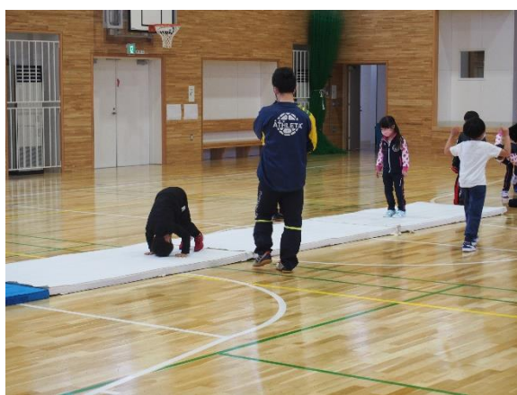
【授業の様子】できる取組・活動からをしっかりと

6月1日より学校再開となりました。マスク越しからも子どもたちの笑顔と楽しそうな声が校舎内に響き渡るようになりました。1学期は、「新しい生活様式」の定着を図り、学習内容や生活リズムを取り戻すことを大切にした教育活動に取り組んでいます。