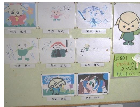
タブレットで制作したオリジナル「あつもん」(4年生)