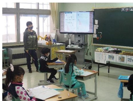
教科書を書画カメラで映す(1年生)