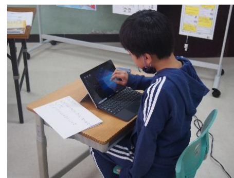
タブレットでの調べ活動(2年生)