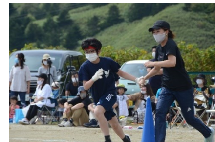
借り物競争(5・6年生)