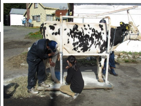
搾乳体験(ぶんちゃんの家)

修学旅行は、思い出を作ることはもちろんのこと、本校の総合的な学習の時間テーマ「故郷（ふるさと）北海道を知り、『礼文』の未来を創る」を学習することがねらいです。6年生にとって他地域のよさ、そして、礼文のよさを再認識する旅行となりました。