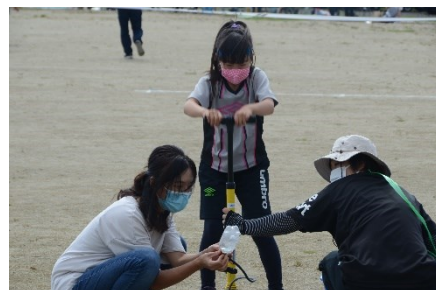
ロケットスタート(3・4年生)