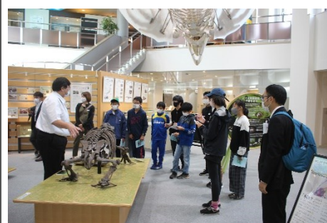
オホーツクミュージアムえさし