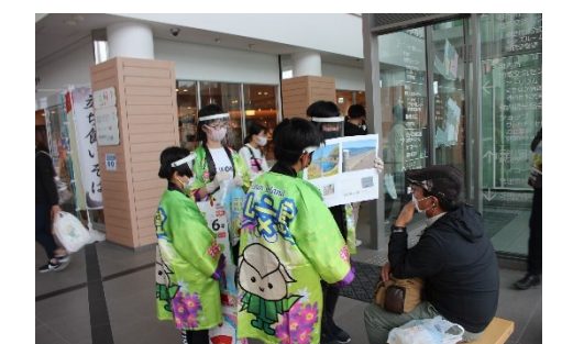
観光大使活動(稚内駅)