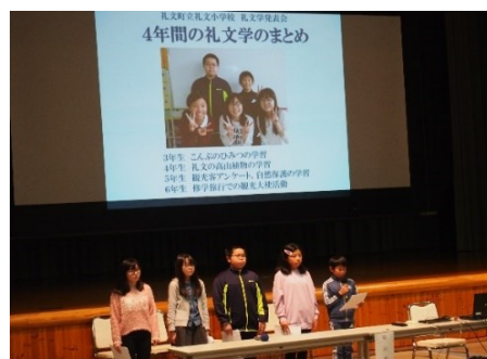
「礼文学発表会」（6年）写真は昨年度