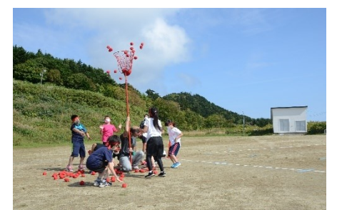
チーム対抗玉入れ