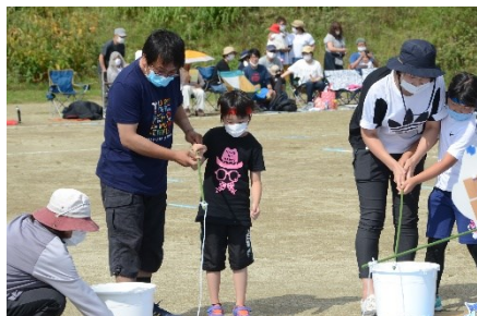
礼文スピリッツ(1・2年生)