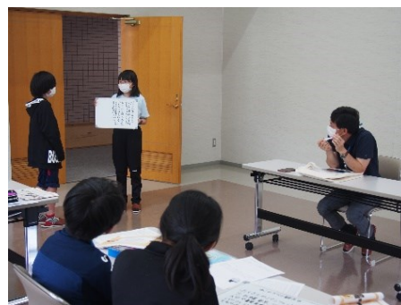
「礼文島の観光」ワークショップ（5年）

「礼文学」から、「よき町づくり、よき自分づくり」について考え、未来に向かってよりよく生きる力を育てています。