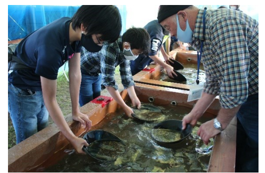
砂金掘り体験(ウツナイ砂金採掘公園)