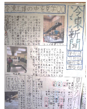
「冷凍工場見学」まとめ（4年）