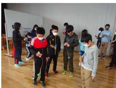
ステージの活用（中休み）