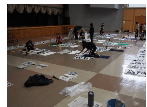
ピスカ21を借用(写真は書写の授業)