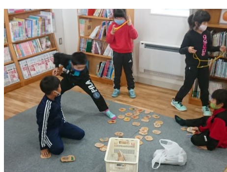
のびのびスペースの活用（中休み・鼓笛練習等）