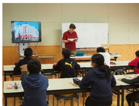
食堂を使用した授業