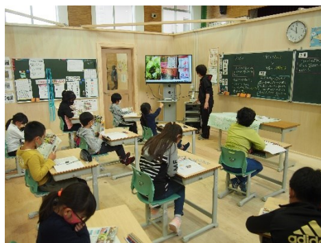
仮設教室での授業

長期間の工事となりますが、子どもたちの学習環境を工夫しながら最大限整えて参ります。ご理解とご協力をお願いいたします。