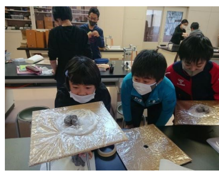
香深中学校施設を借用（理科室・体育館ほか）