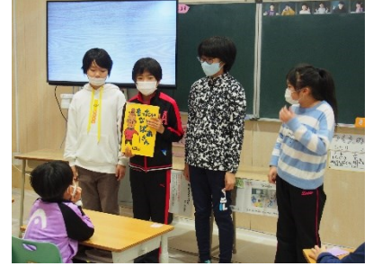
絵本読み聞かせ(文化委員会)