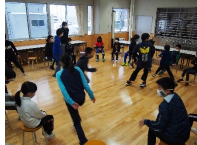
集会遊び(集会委員会)