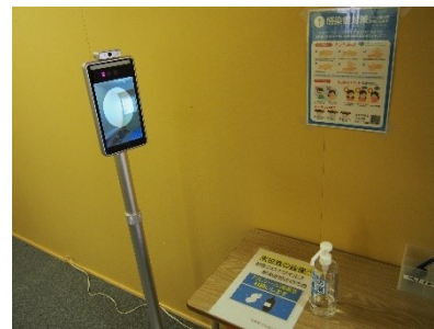
非接触型検温器(玄関前設置)

町教委より新型コロナウイルス感染症対策として、11月に非接触型検温器（サーモマネジャー）、1月に空気清浄機が配備されました。非接触型検温器は玄関、空気清浄機は各教室に設置し、継続して感染症対策に取り組んでいます。