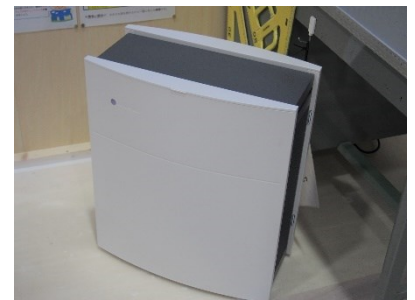
空気清浄機(各教室設置)