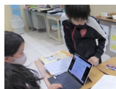
情報収集の様子(4年生)