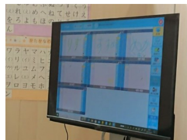
ディスプレイの活用(1年生)