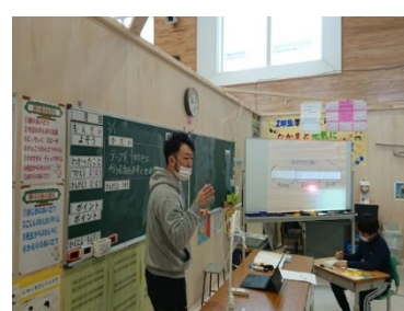
プロジェクターに投影(2年生)