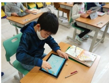
タブレットで字の確認(1年生)